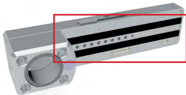
Pic. 9: Enlever les bandes microfibrilles

On peut alors rincer les bandes microfibrilles en y versant de l'eau claire. Avant de réutiliser la machine, presser à nouveau les bandes microfibrilles. La durée de vie de ces bandes microfibrilles dépendra de leur usage. Nous recommandons de changer ces bandes microfibrilles après 100 cycles de nettoyage environ, bien que cela dépende de l'état des disques nettoyés.